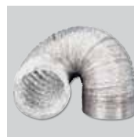
GSA-100 Condotto flessibile in alluminio.