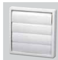
PER-100W Serranda di gravità.